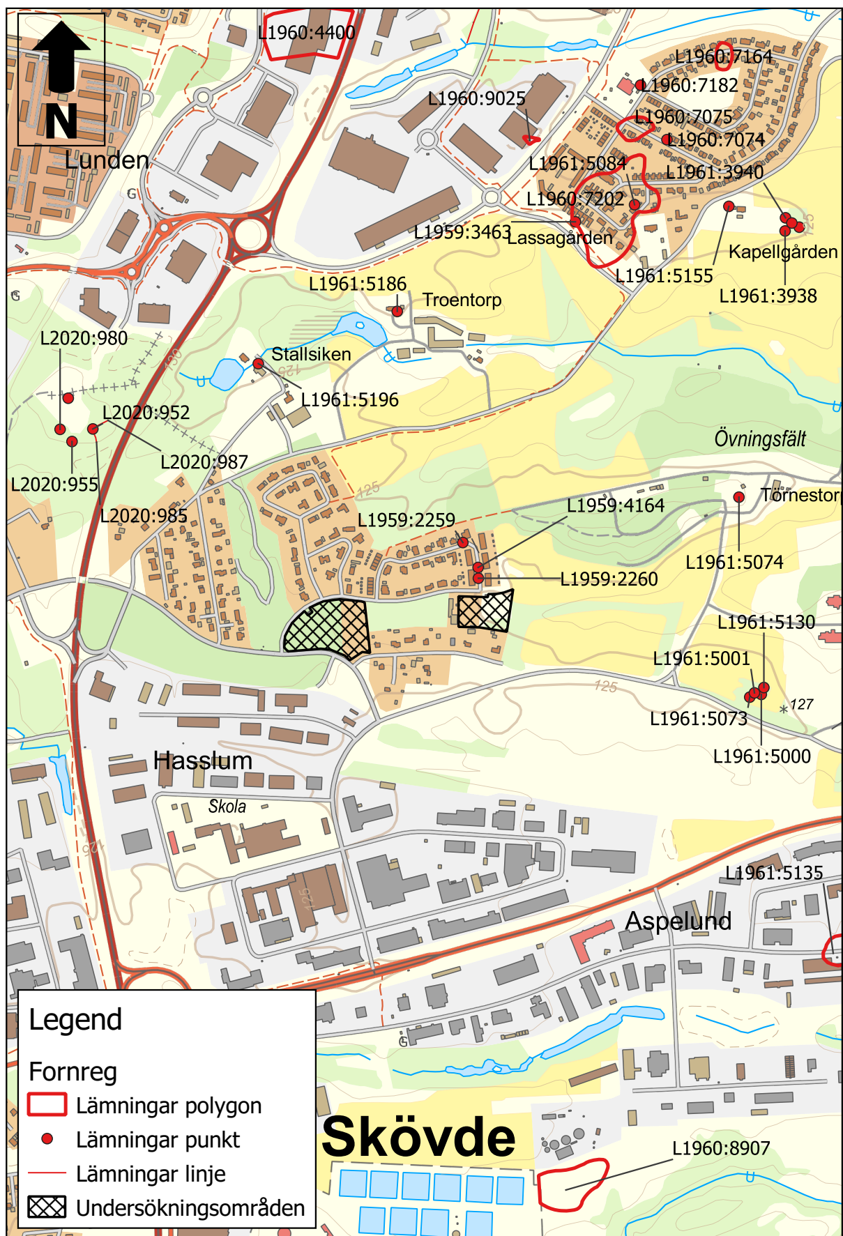
Figur 2. Översiktskarta med kända fornlämningar och övriga kulturhistoriska lämningar samt aktuella undersökningsområden. Skala 1:20 000.