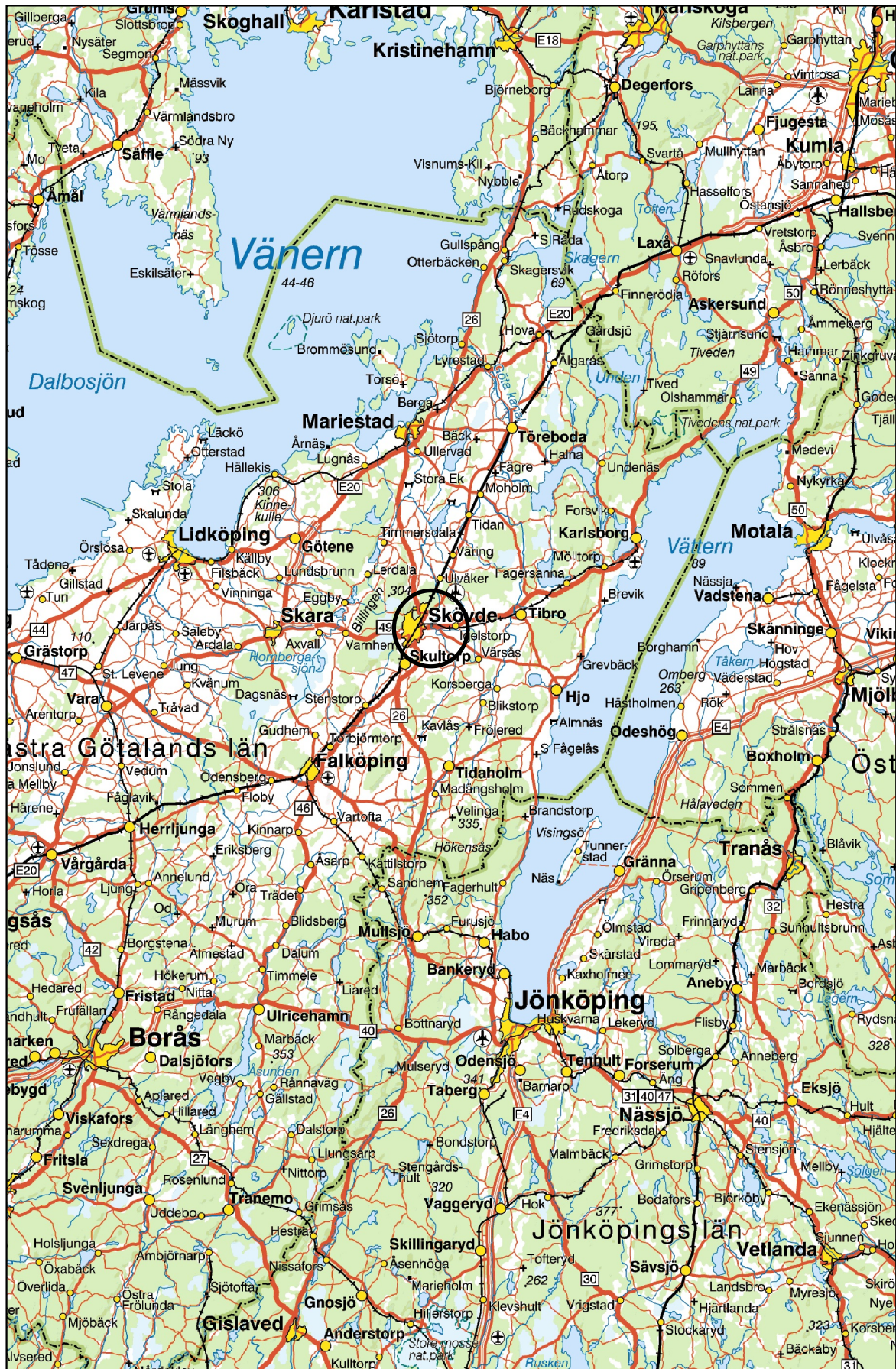
Figur 1. Översiktskarta med platsen för undersökningen markerad (ring). Skala 1:1 000 000.